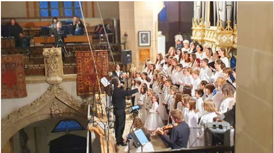
Taizé-Musikabend, in Zusammenarbeit mit der Freien Waldorfschule Sophia in Kronstadt, 27. Oktober 2023