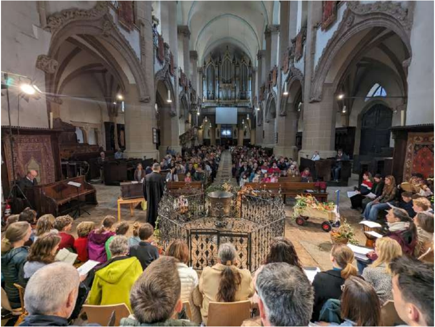
Erntedankgottesdienst mit Groß und Klein, 22. Oktober 2023