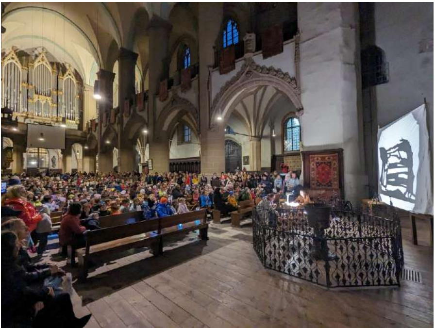
Martinsfest für die Schüler der Honterusschule, 10. November 2023