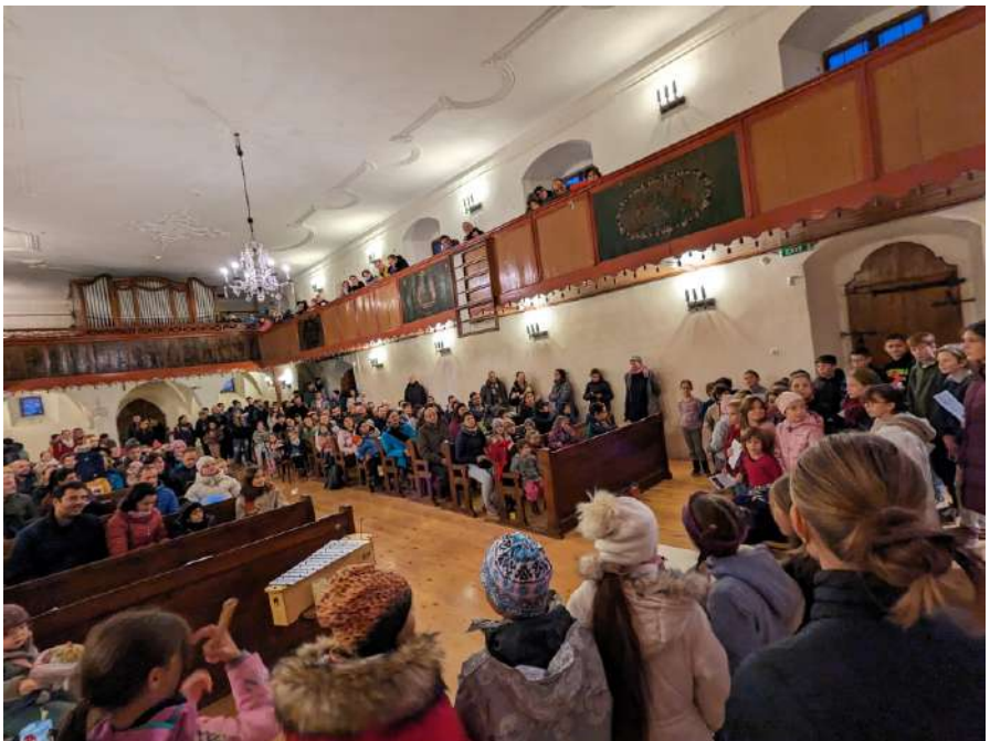
Martinsfest für die Gemeinde, 12. November 2023